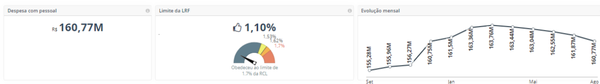
Figura 1 – Percentual e montante da despesa com pessoal – 2º quadrimestre de 2019

Portanto, constatou-se que o RGF publicado pela Assembleia Legislativa evidencia o percentual de 1,10% da despesa total com pessoal sobre a RCL ajustada, o mesmo percentual apurado pelo TCEES mediante o Painel de Controle da Macrogestão Governamental, sendo inferior ao limite Legal (1,70%), ao limite Prudencial (1,615%) e ao “limite” de Alerta (1,53%), todos estabelecidos na LRF.